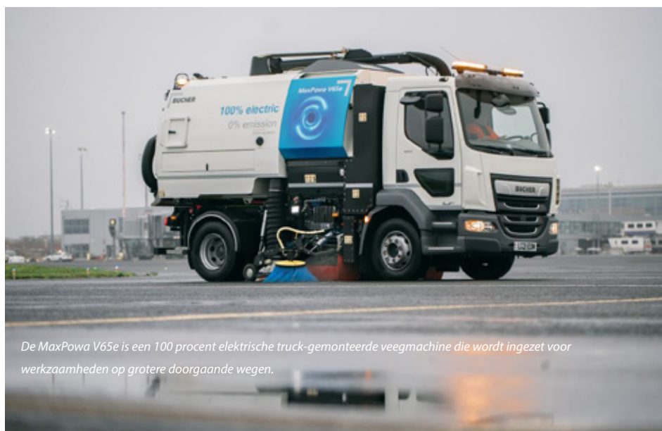
De MaxPowa V65e is een 100 procent elektrische truck-gemonteerde veegmachine die wordt ingezet voor werkzaamheden op grotere doorgaande wegen.

Terberg Matec Nederland presenteert op de Reinigingsdemodagen zijn nieuwste elektrische aanwinst: de Bucher CityCat VR50e. Het eerste exemplaar van de 4 kuubs compacte veegmachine, die vooral geschikt is voor het reinigen van woonwijken, is inmiddels in ontvangst genomen door De Jong Zuurmond. De redactie van Stad + Groen reisde naar IJsselstein om verslag te doen van de gebruikerservaringen van de eigenaar.