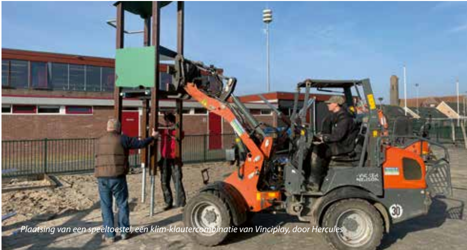
Plaatsing van een speeltoestel, een klim-klautercombinatie van Vinciplay, door Hercules