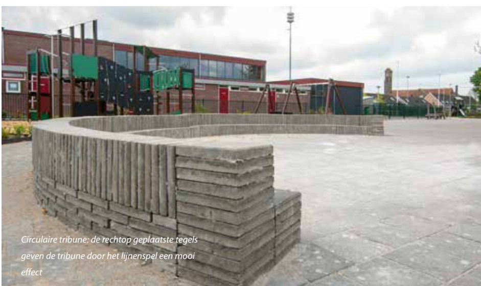
Circulaire tribune: de rechtop geplaatste tegels geven de tribune door het lijnenspel een mooi effect

Het klimtoestel dat Hercules geplaatst heeft, heeft een grote capaciteit. 'Dat is op een school ook wel nodig', legt Bakker uit. 'Op een speelplek in een woonwijk heb je een geleidelijk aanbod van kinderen; op school komen er 100 kinderen tegelijk naar buiten. Dan is er wel de capaciteit nodig om al die kinderen in één keer kwijt te kunnen. Dit toestel heeft veel toegangen, met zes torens en verschillende netbruggen ertussen. Zo voorkom je files. Om verdere drukte te voorkomen, proberen we ook ruimte te creëren tussen de toestellen.' Het inrichten van een schoolplein vergt dus een iets andere aanpak dan een speelplek in een wijk. 'Je wilt voor alle kinderen iets betekenen. Sommige kinderen willen helemaal niet op een toestel; die willen liever rust. Ook met hen willen we rekening houden.'