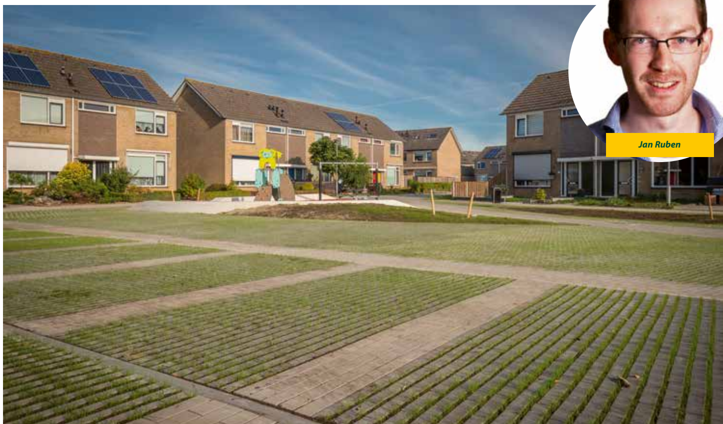
Door het toepassen van TerraViva tussen de Hydro Lineo is een mooi groen parkeerterrein ontstaan.