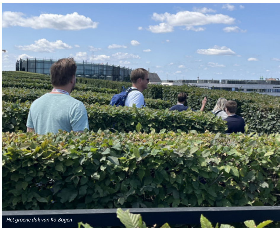
Het groene dak van Kö-Bogen