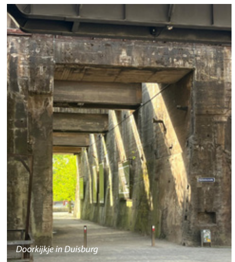
Doorkijkje in Duisburg