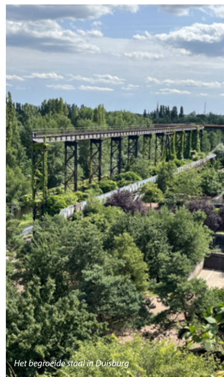
Het begroeide staal in Duisburg