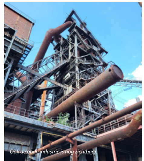
Ook de oude industrie is nog zichtbaar.