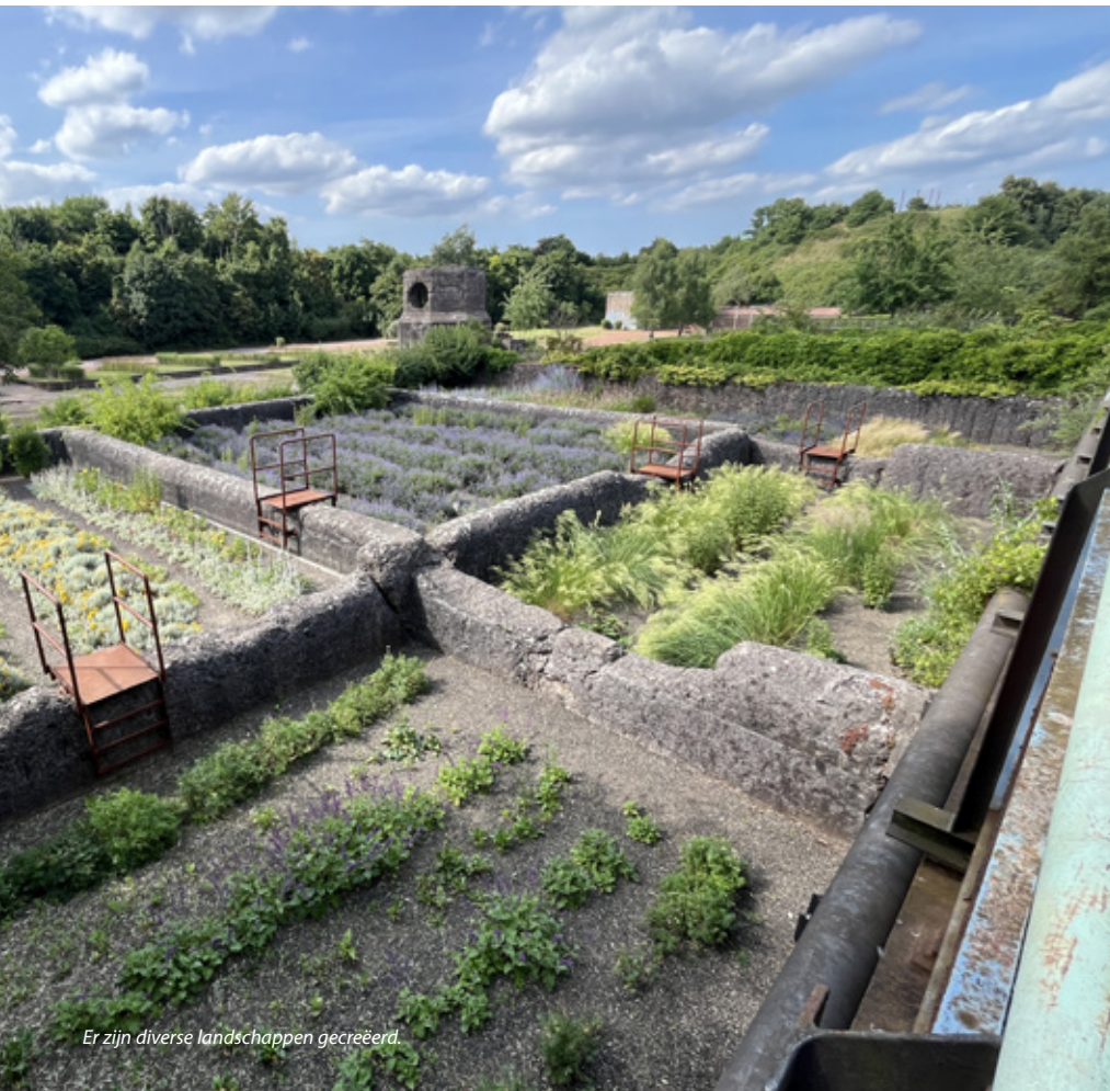
Er zijn diverse landschappen gecreëerd.

Voor de herinrichting werd een prijsvraag uitgeschreven, waaraan zo'n 50 bureaus uit de hele wereld deelnamen. Omdat er vanwege de complexiteit van het gebied zorgen waren over de potentiële plannen en inrichting, koos de overheid voor iets wat leek op een Nederlandse aanbestedingsprocedure. Vijf teams, zowel Duitse als buitenlandse, werden uitgenodigd om binnen een half jaar op locatie een plan te maken. In die periode werden er ook vegetatie-inventarisaties gemaakt om vast te leggen wat er precies groeide.