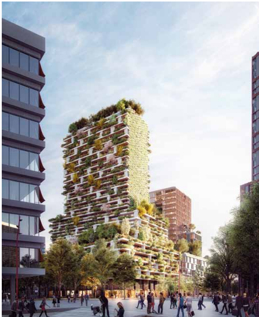
Ontwerp van 'Wonderwoods' op de Utrechtse Jaarbeursboulevard. Stefano Boeri Architecten en de architecten van MVSA ontwerpen ieder een toren. (Foto: A2 Studio / Stefano Boeri Architectti).

'Dat gebeurt centraal. De bomen en planten zijn een soort gemeenschappelijk bezit van de bewoners en het groen vormt een onderdeel van het gebouw. Een centrale post volgt de conditie van de planten en heeft zicht op een systeem van sen-