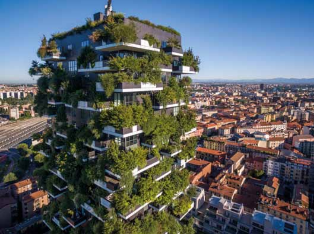
Het Bosco Verticale in Milaan (Foto: Stefano Boeri Architetti – Davide Piras).