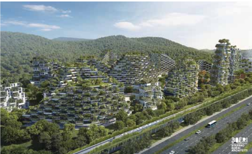
De Chinese futuristische bosstad Liuzhou Forest City, die in 2022 gereed moet komen (Foto: Stefano Boeri Architeti).

een kolossaal gebouw met bomen, struiken en planten te creëren. Toen vervolgens het bedrijf van Hines uit Houston (Texas) als klant aanklopte met het verzoek om twee torens te ontwerpen, heb ik hem dit idee van de Vertical Forests gesuggereerd. In het begin was Hines tamelijk sceptisch. Hij zei dat we groen licht zouden krijgen als we aan enkele voorwaarden konden voldoen. Daarbij ging het om technische vragen die we moesten beantwoorden, zoals de kwestie: hoe kunnen we ons voorstellen dat de bomen op 120 meter hoogte in extreem winderige omstandigheden kunnen overleven? Vervolgens zijn we met een groep experts, botanisten en ingenieurs zes maanden aan het werk gegaan om zijn vragen te beantwoorden. Uiteindelijk lukte het ons en konden we aan de slag.'