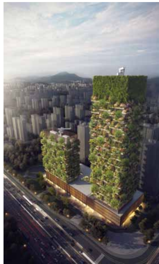
In het Chinese Nanjing worden momenteel twee verticale bossen gebouwd. (Foto: Stefano Boeri Architetti).

'Het gaat mij helemaal niet om beroemd zijn. Ik ben enkel bezig met manieren om onze toepassingen te verbeteren. We hebben met het verticale bos een prototype gecreëerd. Ik zie de groep mensen met wie ik werk als personen die de mogelijkheid hebben gekregen om een raam te openen naar een ruimte die nog niet bestond. In dat proces gaan we iedere keer weer enkele stapjes vooruit ten opzichte van wat we eerder hebben bereikt. Ik denk dat deze "groene" torens een architectonisch experiment vormen. We zijn een nieuw type architectuur begonnen en vervullen daarmee een pioniersrol. Kom een keer naar Milaan; dan laat ik je zien hoe prachtig het eruitziet.'