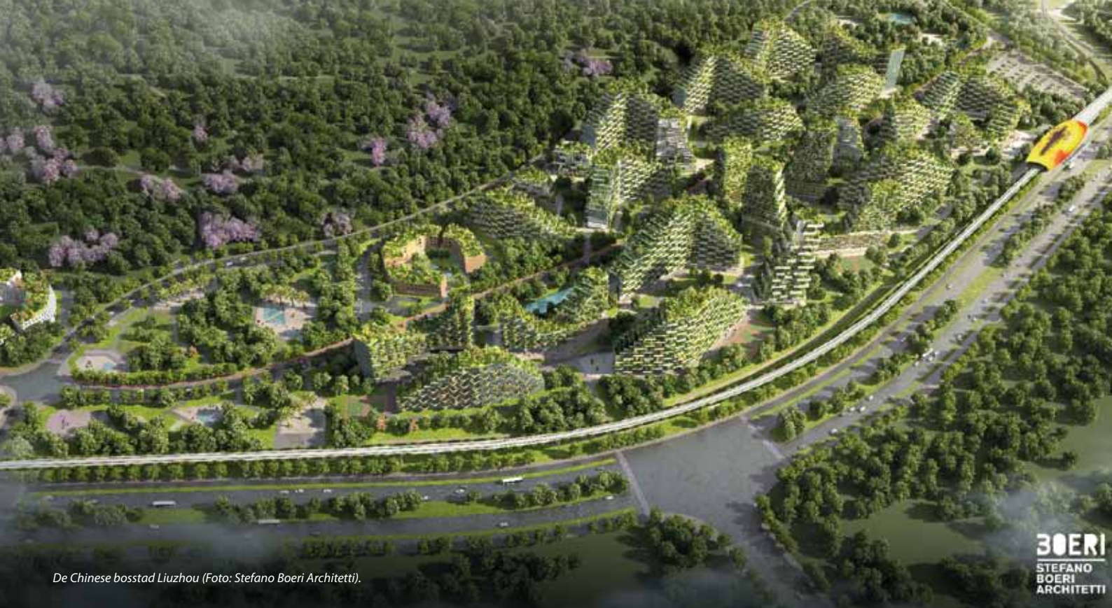
De Chinese bosstad Liuzhou (Foto: Stefano Boeri Architetti).