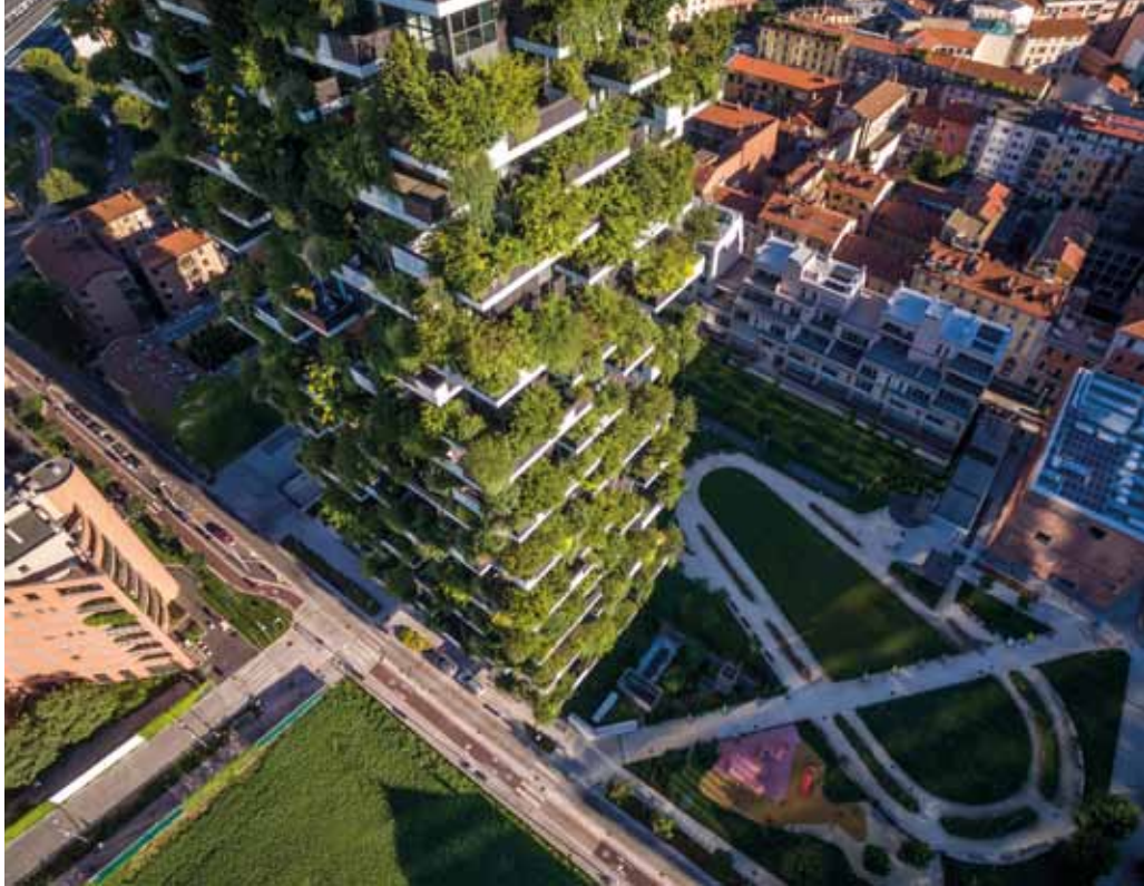
Het enige reeds voltooide verticale bos in Milaan – (Foto: Stefano Boeri Architeti – Davide Piras).

'De directe aanleiding vormde een bezoek aan Dubai met een groep studenten in 2005. Die stad in de Verenigde Arabische Emiraten heeft een woestijnklimaat en heeft een explosieve groei doorgemaakt met honderden nieuwe glazen wolkenkrabbers. Daar, staande bij zo'n enorme glazen pilaar in de hitte van de zon, kreeg ik het idee om