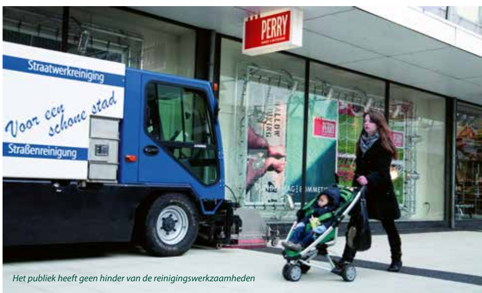
Het publiek heeft geen hinder van de reinigingswerkzaamheden

Gemiddeld wordt er door Jadon jaarlijks 12.000 vierkante meter straatwerk gereinigd in de Arnhemse binnenstad. Daarnaast wordt het busstation viermaal per jaar gereinigd en jaarlijks het gehele station Arnhem Centraal waarbij niet alleen vloeren, maar ook perronoverkappingen, staalconstructies, glas en wanden worden aan-gepakt.