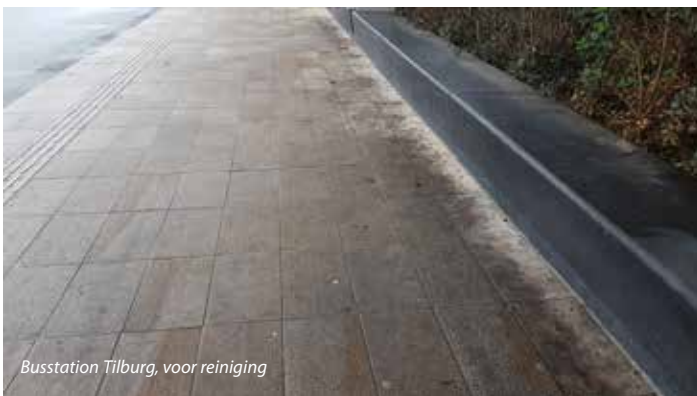
Busstation Tilburg, voor reiniging

gebakken klinkers weer in hun originele kleur en als nieuw.' In Arnhem reinigt Jadon uitgangsbied de Korenmarkt en de winkelstraten. 'Op de Korenmarkt is het tijdens Koningsnacht één groot feest en is het gebied een festivalterrein. Na het feest plak je aan de vloer vast. Direct na de festiviteiten, als er geveegd is, komt Jadon schoonmaken en kunnen alle terrasjes weer uitgezet worden. Daarnaast selecteren we jaarlijks