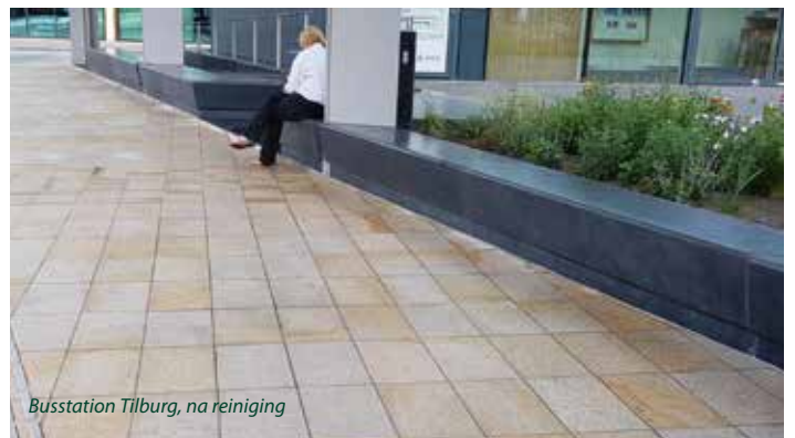
Busstation Tilburg, na reiniging